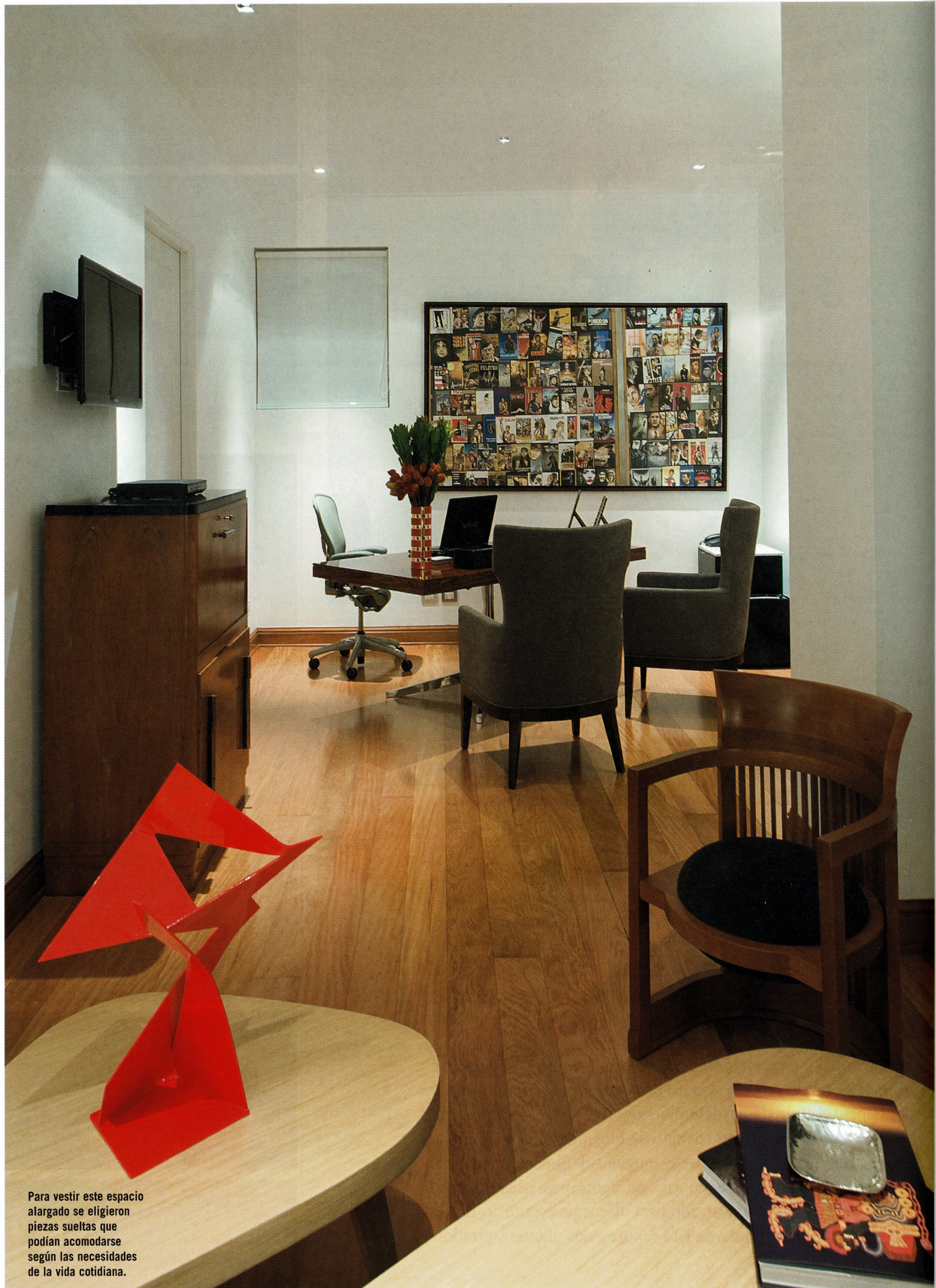
Para vestir este espacio alargado se eligieron piezas sueltas que podían acomodarse según las necesidades de la vida cotidiana.