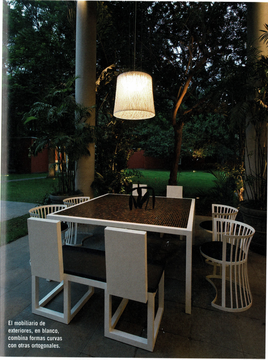
El mobiliario de exteriores, en blanco, combina formas curvas con otras ortogonales.

Para el dormitorio principal, las decoradoras trabajaron una cabecera por delante del muro del fondo, acentuando un efecto de luz. Las dos mesas de noche, a pesar de estar enchapadas en ébano color oscuro, se ven ligeras por su forma geométrica de intenciones esculturales. Frente a la cama se sientan dos banquetas enchapadas en espejo color bronce. “Tanto los materiales como las telas y acabados de este ambiente han sido pensados buscando un espacio de lectura y calma”, señala Grimberg. En el dormitorio de una de las hijas, la alfombra de lana cierra la composición al ofrecer un elemento gráfico que complementa el lienzo colorido, y así se convierte en el punto focal de la habitación. ■