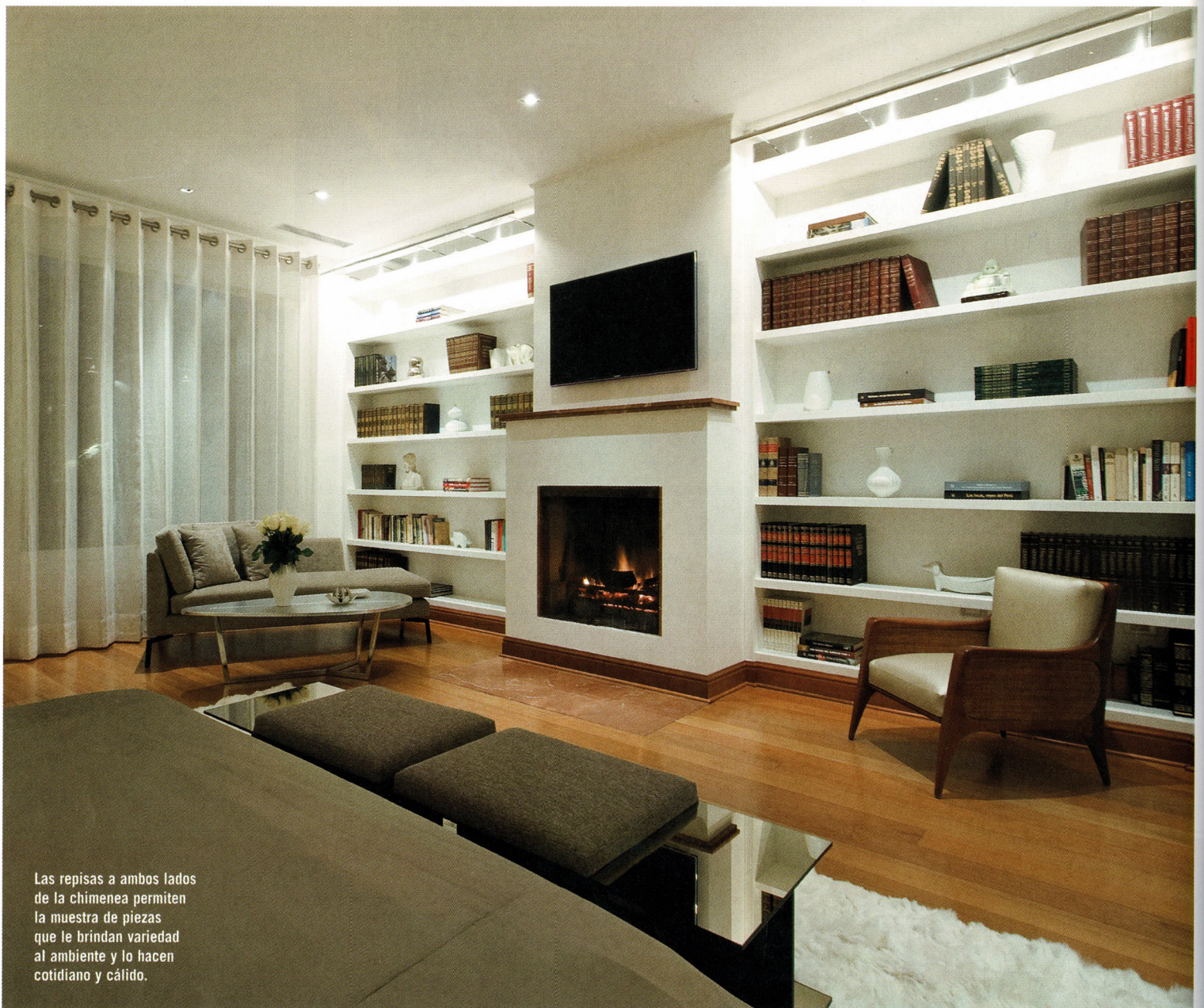
Las repisas a ambos lados de la chimenea permiten la muestra de piezas que le brindan variedad al ambiente y lo hacen cotidiano y cálido.

"PREDOMINA LA BÚSQUEDA DE LA ARMONÍA VISUAL . NO SOLO EN LA PERCEPCIÓN INDIVIDUAL DE CADA AMBIENTE SINO EN TÉRMINOS DE LA MEMORIA VISUAL , FRUTO DEL RECORRIDO DE LOS ESPACIOS".