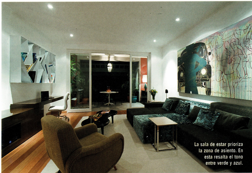
La sala de estar prioriza la zona de asiento. En esta resalta el tono entre verde y azul.

“En este proyecto hemos trabajado con tapices de colores neutros, donde el arte da un contrapeso de color a los ambientes. Predomina la búsqueda de la armonía visual. No solo en la percepción individual de cada ambiente, sino en términos de la memoria visual general