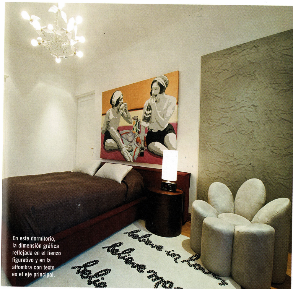
En este dormitorio, la dimensión gráfica reflejada en el lienzo figurativo y en la alfombra con texto es el eje principal.

peldaños de la escalera, se colocaron fotografías en blanco y negro de Sonia Cunliffe, todas de la plaza San Martín, tomadas a través de la ventana de un edificio antiguo del centro de Lima y enmarcadas con acrílico que hacen contrapeso visual a la instalación de cables. “Aquí se decidió buscar piezas de arte que rompieran el clasicismo de la entrada pero respetaran su proporción”, señala Grimberg. En la sala se utilizó la chimenea como punto visual de referencia, y en simetría con ella se colocaron los sofás, cada uno con una consola de espejo detrás donde, a su vez, reposan esculturas como una de acrílico de Amelia Weiss y otra pieza de cerámica de los años 20. Finalmente, una banqueta de Le Corbusier de cuero color champán claro y un cuadro de Jorge Tacla completan la composición de la sala, junto con una alfombra de Mahal (persa) de cien años de antigüedad.