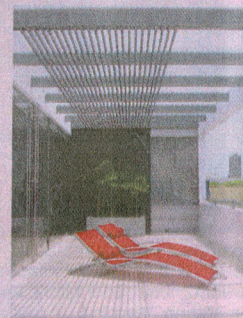
DESCANSO. El loft cuenta con una terraza semi techada.