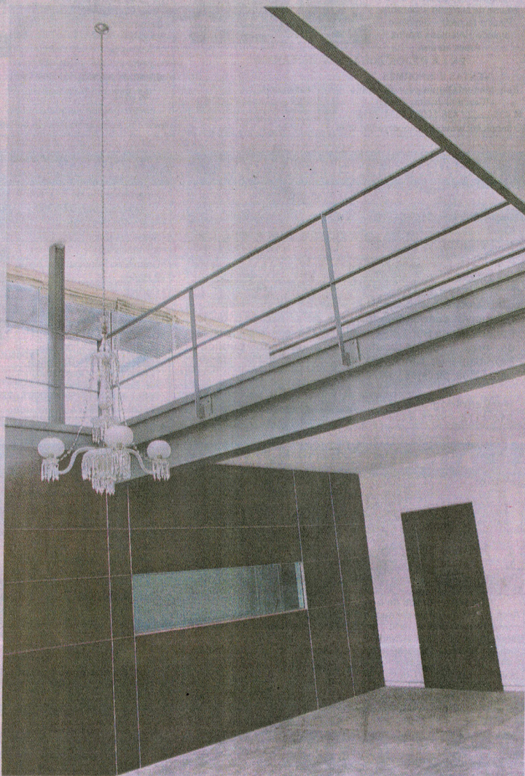
CONTRASTE. Los materiales industriales y modernos realzan la presencia de los elementos antiguos.

La escalera flotante con pasos metálicos deja a la vista su viga de anclaje en el muro, convirtiéndose en la protagonista del espacio. Esta le imprime al ambiente una apariencia industrial que enriquece el diseño. En la planta alta se encuentra en primer plano el baño, oculto tras una puerta corrediza