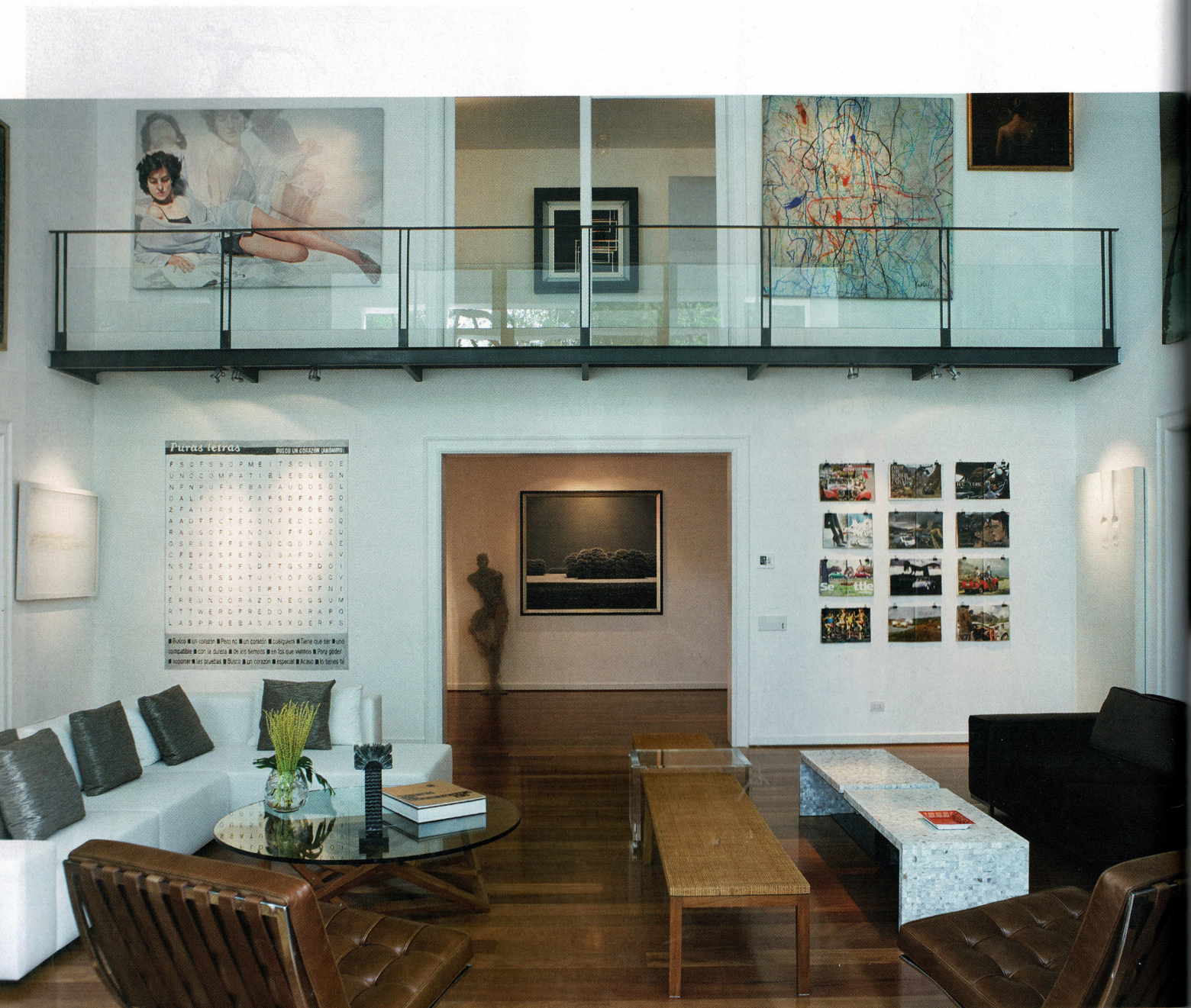
Galería privada. Un puente o balcón estilo industrial instalado en la sala, sirve para comunicar el segundo piso con el salón principal, pero sobre todo, permite colgar y limpiar los cuadros. Además, en la parrilla de hierro se han colocado las luces específicas que iluminan las obras de arte, hacia arriba y hacia abajo.

Como buen amante del arte contemporáneo, el dueño de este departamento quería que la decoración de su casa no compitiera con su fascinante colección de obras de diferentes artistas, peruanos y extranjeros. “Lucir la gran cantidad de